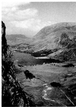
Buttermere from Haystacks aus dem Jahr 1941 von W.A. Poucher.

In Artikel 6 der Richtlinie heißt es, daß die neue Schutzfrist für alle Fotos gelten muß, die "individuelle Werke in dem Sinne darstellen, daß sie das Ergebnis der eigenen geistigen Schöpfung ihres Urhebers sind", und daß "zur Bestimmung ihrer Schutzfähigkeit keine anderen Kriterien anzuwenden sind". Diese Formulierung ist ein Kompromiß aus der britischen Position, daß alle Fotos, ungeachtet ihres künstlerischen Wertes, geschützt werden müssen und der Vorstellung, daß nicht alle Fotos als künstlerische Werke angesehen werden sollten. Es ist zu erwarten, daß in denjenigen Ländern, in denen bislang diese Unterscheidung galt, viele Fotos, die vorher nicht als künstlerische Werke eingestuft waren, nun als individuelle Werke im Sinne der Definition in der