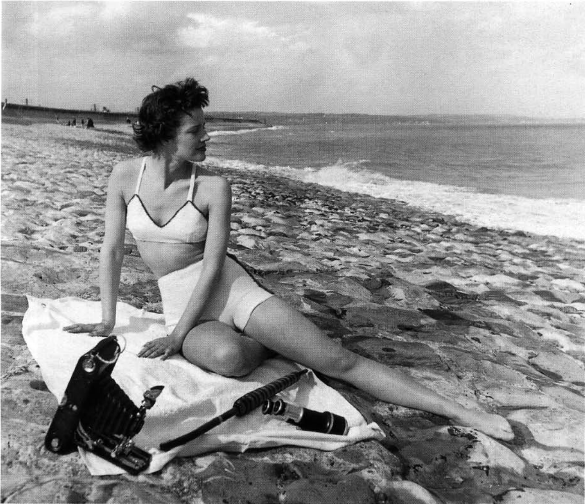
Bill Brandts Fashion on Sea aus dem Jahr 1948 wird auf Jahre hinaus von der geplanten Richtlinie über die Urheberrechtsschutzfrist profitieren.