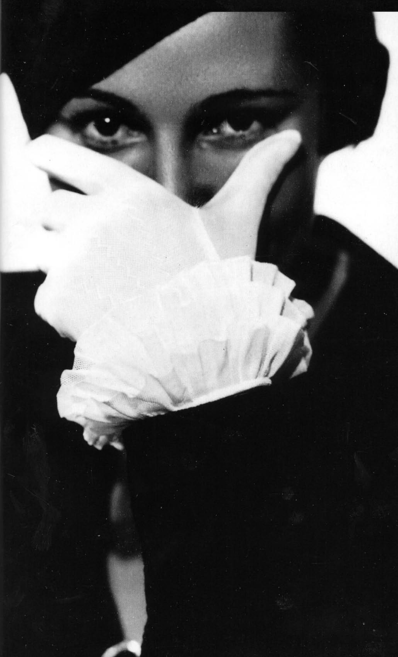
Gant de trill, stockingette & lace von Nicolet, Paris c.1934.